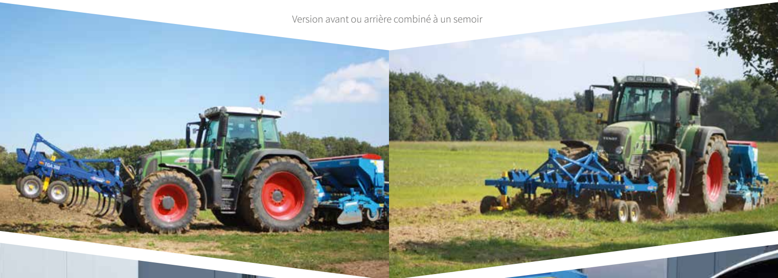
Version avant ou arrière combiné à un semoir

Un escalier d'accès avec plate-forme et rambardes, permettent de remplir la trémie de semence en toute sécurité.